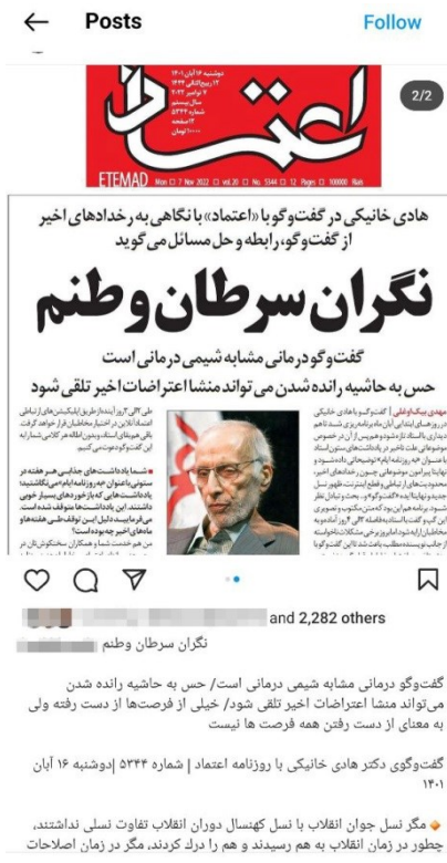
تصویر ۷.

صحبت کردن فضایی را برای بیانگری دربارهٔ رخداد مهر ۱۴۰۱ ایجاد می‌کرد که دیگر محدود به تایپ کردن به صفحه کلید نبود، بلکه در حضور مخاطب امکان بیانگری کلامی حاصل می‌شد. اما او ویدئوهای گرفته شده از جلسه را درون صفحه اینستاگرامش بارگذاری می‌کرد (تصویر ۷) و از هشتگ‌هایی مانند #زن_زندگی_آزادی یا #اعتراضات ۱۴۰۱ استفاده می‌کند تا ایده‌اش را در پیوند با رخداد مهر ۱۴۰۱ بیان کند. جلسه ضبط شده را به فایل اطلاعاتی قابل تکثیر تبدیل می‌کند و به چرخش می‌اندازد. او از تکنولوژی استفاده می‌کند تا تبدیل به ماشین شود و ایده‌هایی را دربارهٔ میدان رخداد تولید می‌کند. برای این دست از اساتید تئیدگی با صفحه کلید برای تایپ ایده‌ها به ندرت رخ داد. اما موقعیت عدم تایپ ایده‌ها را نباید فقط در شدت پایین تبدیل شدن به ماشین دگردیسگر محاسبه کنیم.