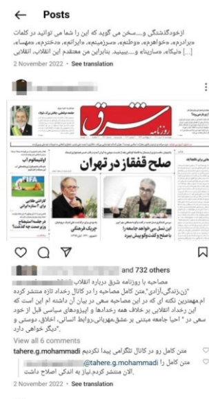
تصویر ۹. برگرفته از صفحه جامعه‌شناس (چ)