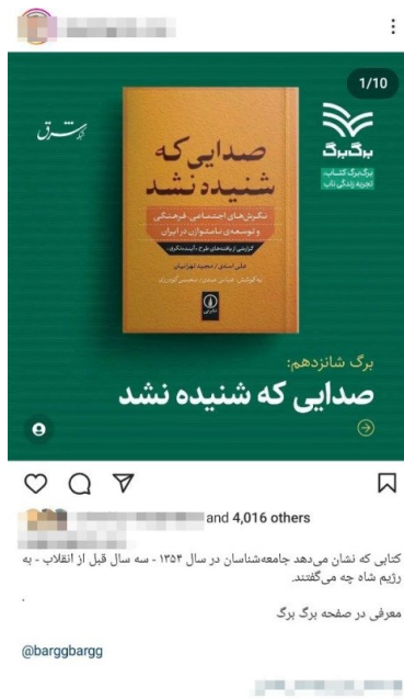
تصویر ۸.