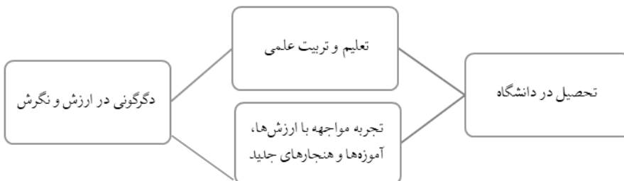
تصویر ۲. فرایند تأثیر دانشگاه بر تغییرات ارزشی و نگرشی دانشجویان

در عین حال، دانشگاه خود دارای یک فرهنگ آکادمیک است که آن را از سازمان‌های دیگر متمایز می‌کند. به موازات آن، هر دانشگاه از خرده‌نظام‌های کوچک‌تری مشتمل بر دانشکده‌ها و گروه‌های آموزشی، اجتماع خوابگاهی، انجمن‌های علمی و تشکل‌های فرهنگی - اجتماعی تشکیل شده است (جوهری، ۱۳۸۳، ۴۲۰). مواجهه با این خرده‌فرهنگ‌ها در فرایند جامعه‌پذیری دانشجویان و نوع تفسیرشان از امور اثر دارد. از سوی دیگر، نظام فرهنگی دانشگاه با نظام فرهنگی خانواده و محلی که دانشجو در آن رشد کرده متفاوت است. تعامل با اساتید و ارتباطات دوستانه جدید همگی این امکان را فراهم می‌کنند که فرد از مرزهای پیشین تجربیات خود فراتر رود. رویارویی با این پنجره‌های گشوده و قرار گرفتن در تقاطع این جریان‌های متکثر، به تدریج اولویت‌ها، اندیشه‌ها و ارزش‌های دانشجویان را تغییر می‌دهد.